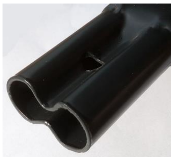
Внешний вид трубы после обжатия

Снегозадержатель трубчатый представляет собой сборную конструкцию для предотвращения неконтролируемого схода снега и наледи с кровли.